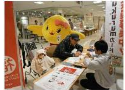
県内外のイベントに出展し会員を募集

Fukurumカードでは、日専連ライフサービス、協会、県の3者が、支援者が負担なく参加できるシステムを構築し、継続的な支援を期待する。一般消費者には、カード入会時に申請書を提出する手間だけで、金銭的な負担は生じない。加盟店からカード会社に支払われる手数料のうち利用額の0.1%相当分が風評対策に活用され、また、利用者には通常のクレジットカード同様にポイントが付与される。